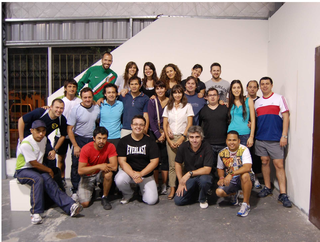
CURSO I.S.A.K., DICIEMBRE 2010